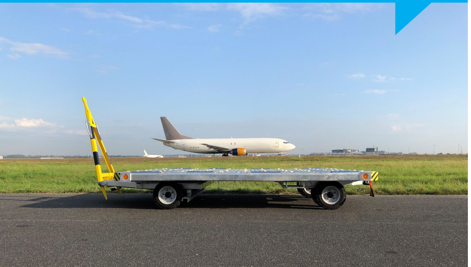
Abbildung: DOLLY D10-101-C-DL

Der Dolly D10-101-C-DL wurde für den Transport von Paletten und Containern unterschiedlicher Formate entworfen, konstruiert und gebaut.