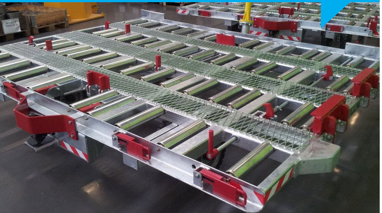
Abbildung: Container Dolly D 10-100-TDQ

Der Container Dolly D 10-100-TDQ der BlumenbeckerTechnik GmbH wurde für den Transport von Paletten und Containern konzipiert. Die stabile Stahlkonstruktion hat ein maximal zulässige Zuladung von ca. 8000 kg . Die gesamte Ladefläche ist mit 4 Rollenbahnen sowie mit Anschlägen, Stopps und Verriegelungen versehen.